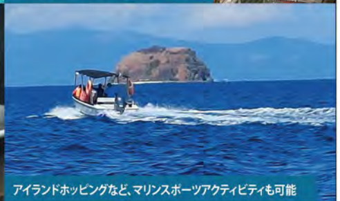
アイランドホッピングなど、マリンスポーツアクティビティも可能