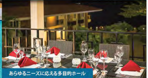
あらゆるニーズに応える多目的ホール