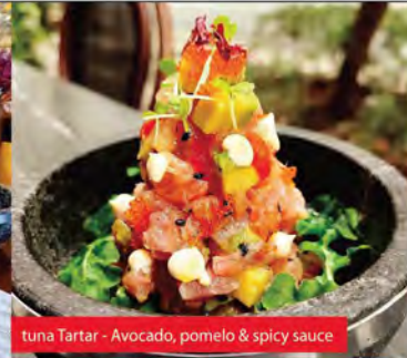
tuna Tartar - Avocado, pomelo & spicy sauce

Paella - Vegetable Paella (Pisto, mushroom, tomato, artichokes).