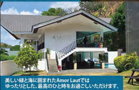
美しい緑と海に囲まれたAmor Lautではゆったりとした、最高のひと時をお過ごしいただけます。