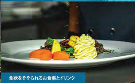
食欲をそそられるお食事とドリンク