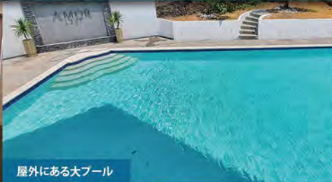
屋外にある大プール