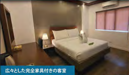
広々とした完全家具付きの客室

☎ 09171087451 📍 Brgy San Jose Mabini Batangas ▶ www.amorlaut.com 🕒 6am-10pm